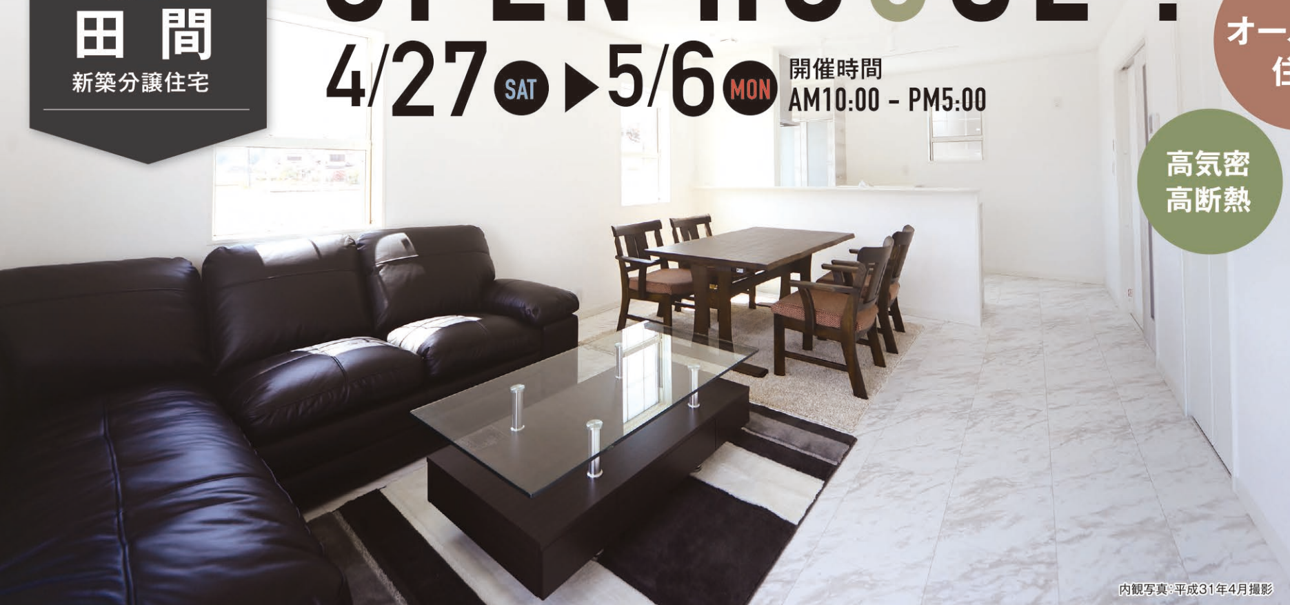
内観写真:平成31年4月撮影