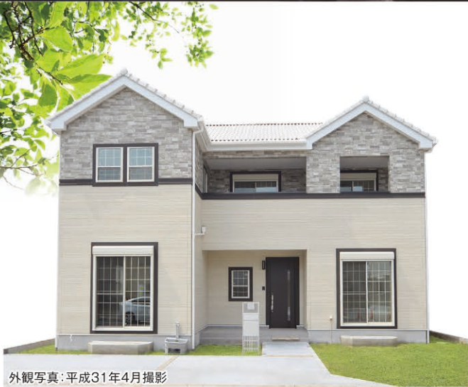
外観写真:平成31年4月撮影

4LDK+5WIC ■敷地面積 207.71㎡(62.83坪) ■建物面積 114.26㎡(34.50坪) 販売価格 3,080万円(税込)