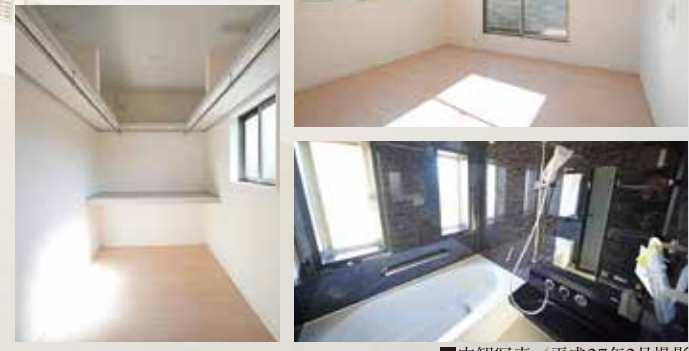
■内観写真/平成27年2月撮影