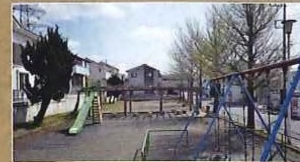
仁戸名第2公園 徒歩1分(10m)