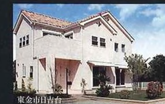
プロヴァンススタイル

憧れのデザイン…クラシカル&モダンなネオ・プロヴァンス・モダン。地中海に面した南仏プロヴァンス地方の伝統的なデザインをモチーフとし、明るい日射しと青空が似合う柔らかなスタイルです。