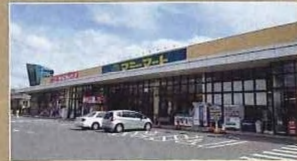
マミーマーケット仁戸名店 徒歩3分(200m)