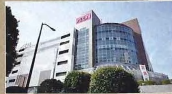
イオン鎌取店 徒歩28分(2,200m)