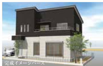
完成イメージパース