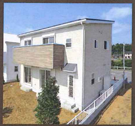
〈内観・外観写真〉平成26年9月撮影