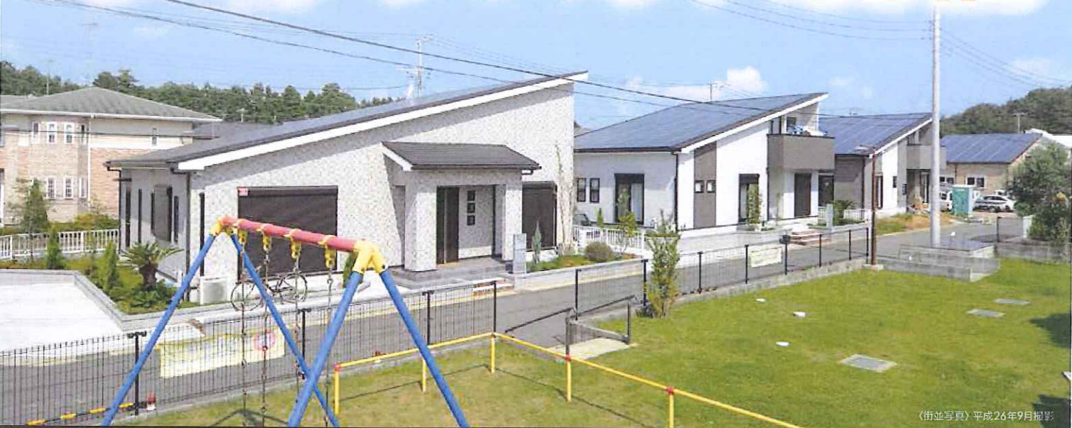
〈街並写真〉平成26年9月撮影

公園に隣接し、緑と快適さに包まれた閑静な住宅街 NAMIKAWA の家族の夢を叶える住まいで のびのびと安心して子育てを楽しみませんか？