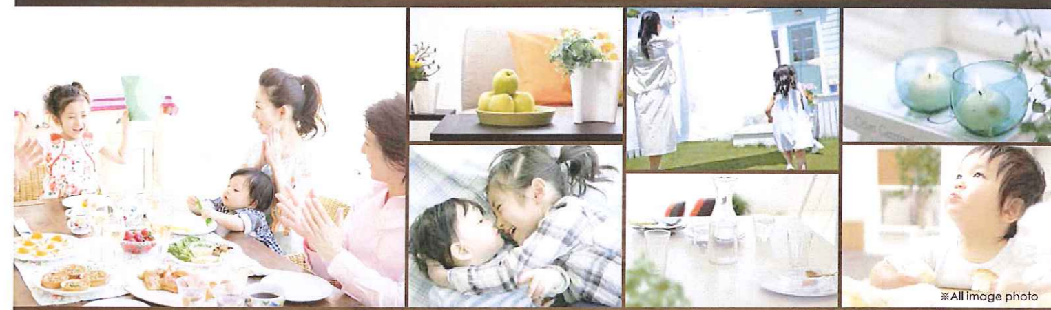
※All image photo

映画のような暮らしをあなたに... NAMIKAWA 株式会社 ナミカワ不動産・八街支店 〒289-1104 千葉県八街市文達301-147 千葉県知事免許(宅)第1276号 国土法人不動産保証協会 全労連千葉県支部加盟 千葉県建設業協会加盟 千葉県建設業協会加盟 0120-39-7288 http://www.nami-kawa.co.jp ナミカワ不動産